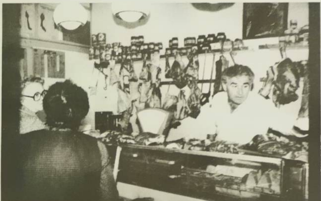
Nitko ne živi (premda ih puno priča o tome) samo od zelenja i -zdrave hrane-. Sve je to lipa ali — koji je to ručak bez bakunića mesa?