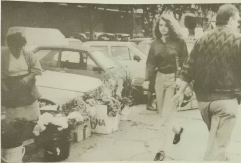
Me možete vi njih premještati, sto puta dnevno i napravili im prigodne štandove, ali to mora platiti ovi gale, cvice među nogama