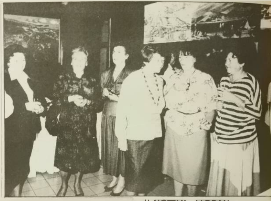
U HOTELU «JADRAN»