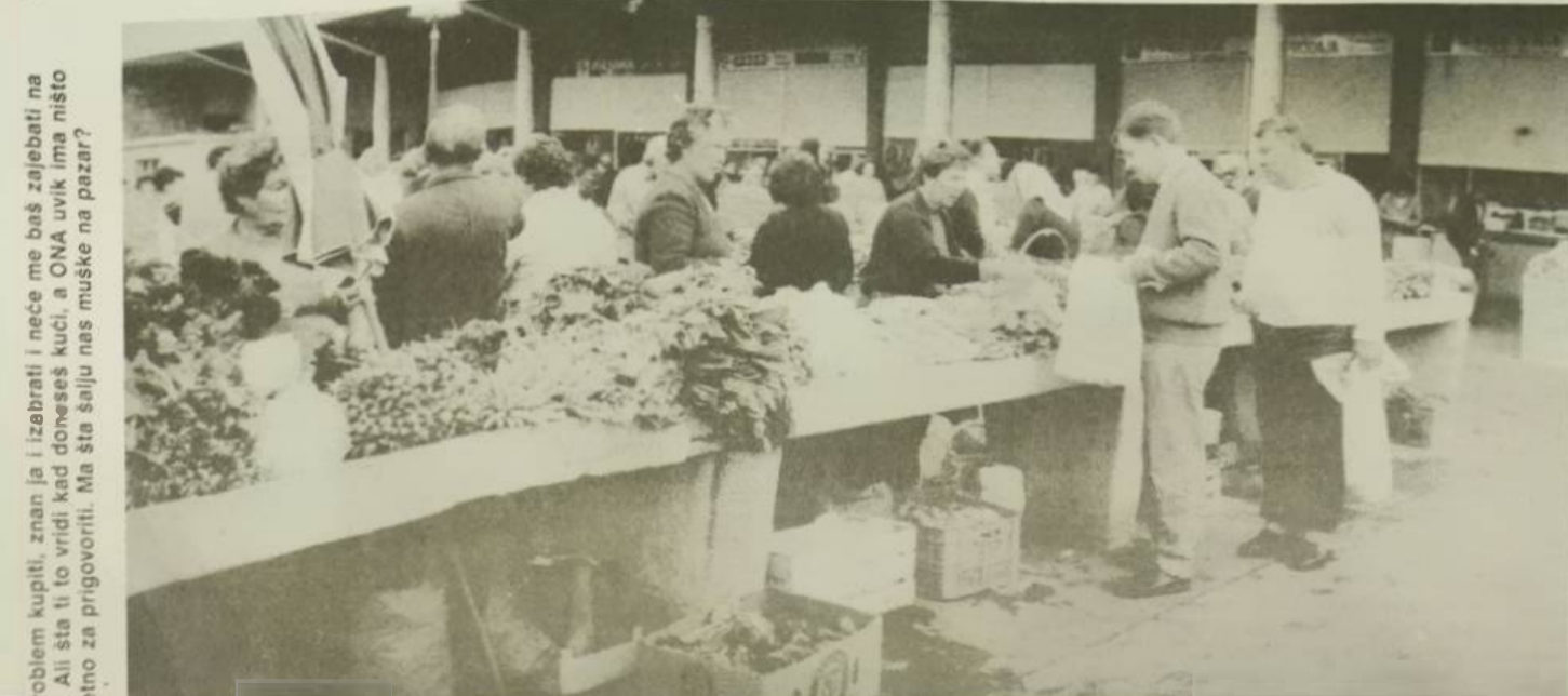
roblem kupiti, znan ja i izabrati i neće me baš zaljebati na Ali šta ti to vridi kad doneseš kući, a ONA uvijek ima ništa etno za prigovoriti. Ma šta šalju nas muške na pazar?