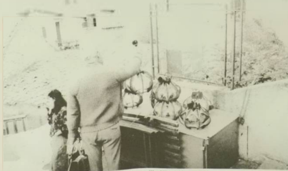
Nakon šaljki, crvenica i čelrni, ova je najzanimljiviji vaterolasti suveniri