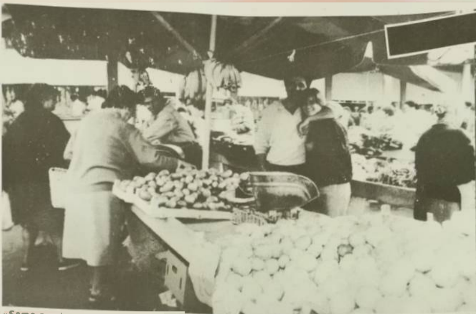
"Samo nas inspekcija restavit može!" Naravno da treba tržiti konkurencija i sve što ide uz to. Ali jopel mi moramo biti skupa