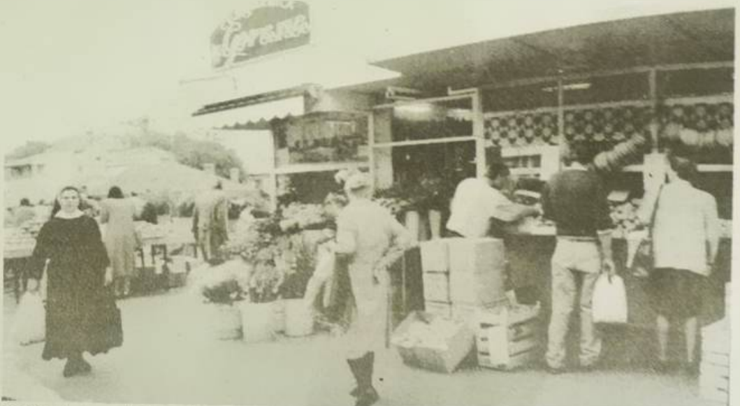
Kad imate (zasad) jednu cvičarnicu s reklamom i »izlogom« ponude onda vam i ona izgleda čudno. Valjda će uskoro biti bolje. Pače, uskoro ide Dan mrtvih, bit će cvića na sve strane.