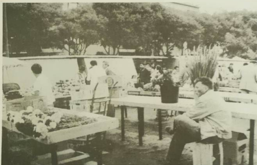
A ne more biti uvijek gužva, dikod valja siditi i zvižditi.