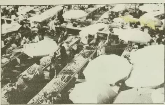
STRANICE 6. I 7.