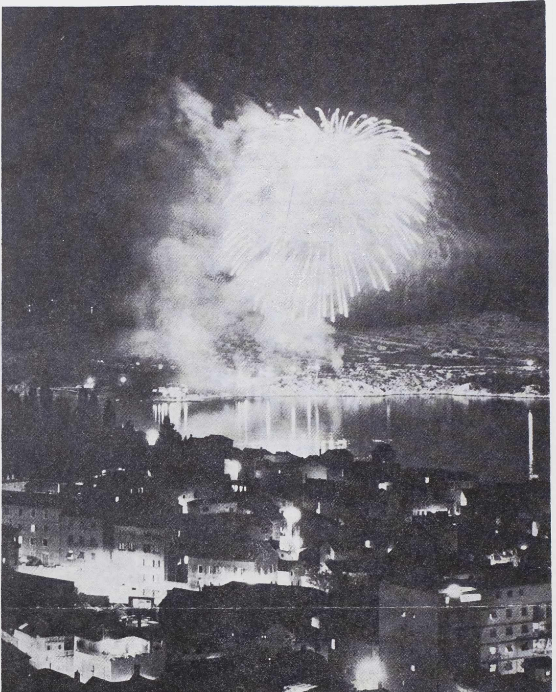
Vatrometno nebo festivalske večeri

u beogradu održana peta godišnja skupština kluba šibenčana i prijatelja šibenika