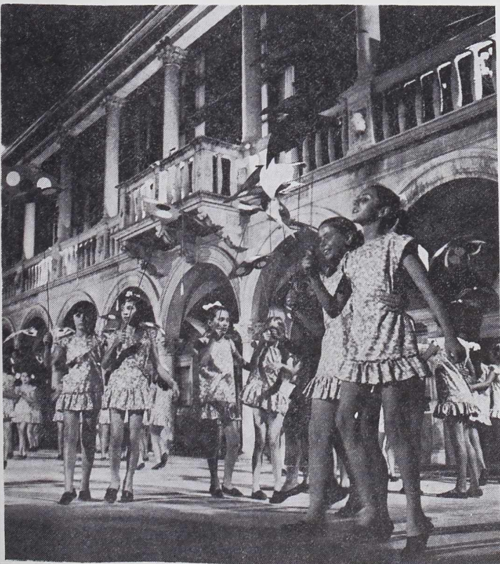
Igre i stvaralaštvo