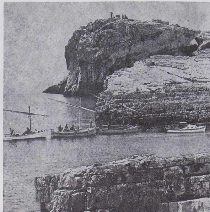
Na domaku čarobnog dječjeg sna