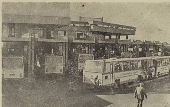
Autobusnom kolodvoru postalo je prljekosno na današnjoj lokaciji